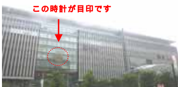
この時計が目印です

まず向かった場所は、3月にリニューアルオープンした博多駅に直結している「JR博多シティ」です。福岡空港から地下鉄に乗り約10分で到着します。ビル内には博多郵便局や阪急百貨、専門店街のアミュプラザ(東急ハンズやシネマコンプレックスが入っています。)等のテナントが入居しています。外から見ると正面玄関上部の大きな時計を中心に左右に広がっていて、ビルの高さに圧倒されます。