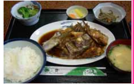
地魚のあら煮昼食

御所浦を訪れる際には、御所浦を知り尽くしたガイドさんに案内をお願いするといろいろな情報が教えてもらえて、さらに楽しめること間違いなしです。