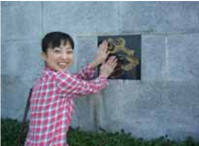
倉岳大えびす像(彫刻の写真)

びす像です。その高さはなんと 10m。像は大理石で出来ているそうです。大えびす像の周囲には彫刻が施されており、写真のように金色の部分に触れると良いことがあるそうです。山口もタッチしました