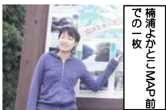
楠浦の眼鏡橋の前