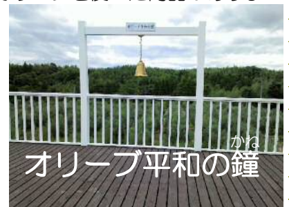
オリーブ平和の鐘

身体にも良い効果が期待できるそうです(〇~)♪天草にお越しの際には、是非お立ち寄りください。