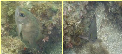
上を向いて泳いでいます♪ 目があっちゃいました～♡

海の中で最初に出会ったのが、「メバル」♪なぜか上を向いて泳いでいました。このメバルがたまたま上を向いているだけなのかなあ、と思っていましたが、この日見たメバルは全て上を向いていました。あとで言うと、この泳ぎをしている時は餌を求めている時だそうです。