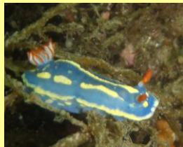
頭部に一對の触角、背中に花びらのようなエラが生えています。

そして今回、潜る前からずっと私が会いたい！と思っていた生き物に会えました～(〇)それは、「ウミウシ」です。「ウミウシ」皆様ご存知ですか？私は、最近知りました。ウミウシは、やわらかい体をもつ軟体動物で頭に生えている2本のツノ（触角）を牛に例えて名づけられた生き物です。体の色や形、大きさが様々異なり、たくさんの種類のウミウシがいることから「海の宝石」と例えられることもあるそうです★私がこの日出会ったウミウシは3種類♪まず、体が青色で赤い触角を持つ「アオウミウシ」。大きさは5cmほど。私が近づいてもビクともせず、岩場にじっとしていました。