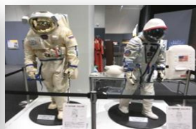
キュリオシティ ロシア船外・内宇宙服