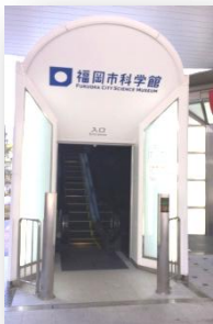
←エスカレーター入口

さて、今年最初にご紹介するのは、昨年の10月にリニューアルオープンしたばかりの『福岡市科学館』です。場所は、地下鉄七隈線の六本松駅の出口からすぐの、九州大学六本松キャンパス跡地にあります。駅の出口から科学館へは直通のエスカレーターがあるので、とても便利です!!