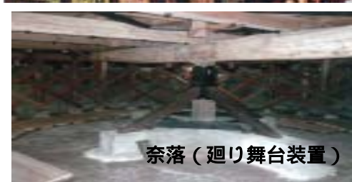
奈落(廻り舞台装置)