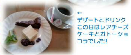
←デザートとドリンク この日はレアチーズ ケーキとガトーショ コラでした!!

前菜も種類が多く、また、パスタの中の自家製ベーコンもジューシーで食べごたえあります! お腹いっぱいになりました(^)!