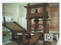
〈天草コレジヨ館より〉

活版印刷とは、活字を組み合わせて作った版で印刷することです。当時の活版印刷は下記のような巨大な木製の印刷機を使用していました。