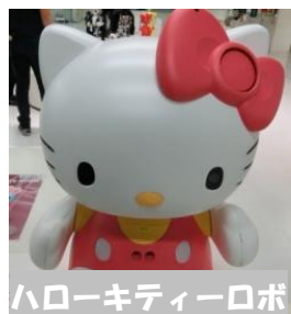
ハローキティーロボ

今回の内容は、ロボットづくしです。私が行ってきたロボスクエア（ROBOSQUARE）はロボットについて学び楽しくふれあうことができる空間です。場所は福岡天神からバスで15分程度、福岡タワー