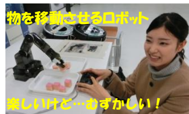
物を移動させるロボット

ロボットとふれあうのは今回が初めてでしたが実物を見てその魅力やコミュニケーションの楽しさを感じることができました。ロボスクエアのとっても可愛くて高性能なロボットの多くが日本の企業により開発されたものだそうです。今後は人に癒しを与えるロボットなど新しい分野でのロボットの活躍が楽しみです。新しく増えていくロボットに会いにまたロボスクエアに行きたいと思っています。個人的には、アイボのような話ができるペット型ロボットが増えていくと嬉しいです。（～）