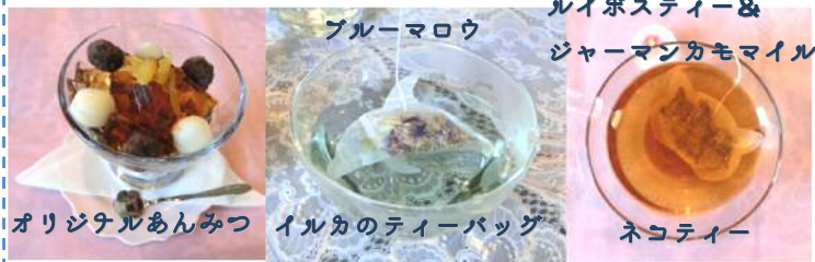
オリジナルあんみつ イルカのティーバッグ ネコティー

また、天草のお土産品としても人気上昇中なのが、 イルカのティーバッグ です。ティーバッグがイルカの形をしているんです！！ティーカップの中を優雅に泳いでいるようです☆他にもネコや星、蝶々の形、リボンやハートの形のティーバッグもあります。（カフェメニューにもあります。）