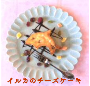
イルカのチーズケーキ

定番商品の他にも季節限定のものもあります。中から今回いただいたのは 特製オリジナルあんみつ です。ほうじ茶の寒天が入っていて、甘すぎずさっぱりとしていて、これまた体に良さそうなスイーツです。季節限定のメニューは暑い間は販売されるそうです。※取材時はまだメニューに出ていませんでしたが、かき氷の販売準備も進めているそうです♡