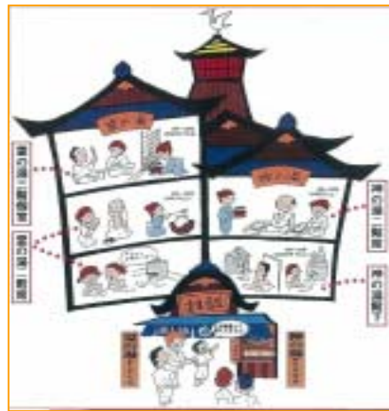
道後温泉本館の見取り図

中でも目を奪われたのが本館の屋上、赤いギヤマン(ガラスに彫刻を施したものの)障子が印象的な望楼、振楼閣でした。この閣内の広さは約1坪。夜になると中央天井の釣ランプを灯したことから、それが赤いギヤマンに反射し、ネオンのない建設当時の湯の町の夜空に異彩を放ったといわれています。残念ながらこの閣内に入ることは出来ませんが、実はこの中には太鼓が吊るされており、今でも6時・12時・18時になると時を告げる刻太鼓として打ち鳴らされています。昔ながらの懐かしい音に湯の町の日が始まり、暮れているなんて本当に風情を感じますね。この太鼓の音は残したい日本の音風景100選に選定されています。道後温泉へお出かけの際にはぜひ耳を傾けてみてください。