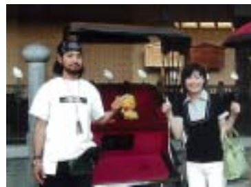
本館前には人力車もありますよ!