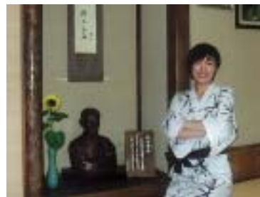
坊ちゃんの間にて 漱石像とハイチース!