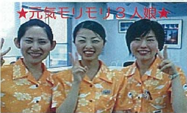
★元気モリモリ3人娘★

このコーナーはC/Aが各就航地へ行き、あなたのまちの観光等をご紹介します。毎月シリーズでお届けしていきます。お楽しみに★★★ また、「あなたのまちの〇〇を紹介してほしい！」といったお客様のお声も心よりお待ちしております！！